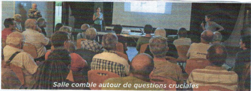
Salle comble autour de questions cruciales